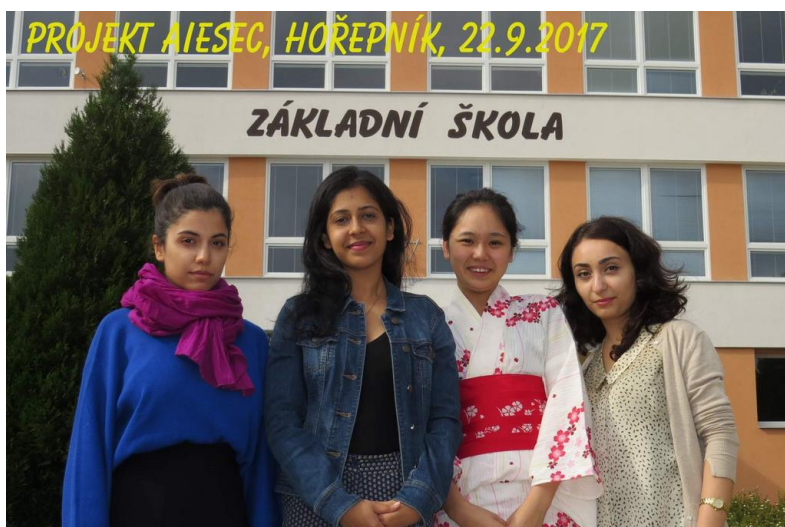
Zahraniční studentky, které byly na škole v Želivě.