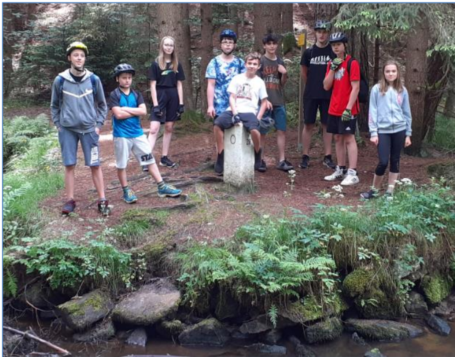
Nejsevernější bod Rakouska