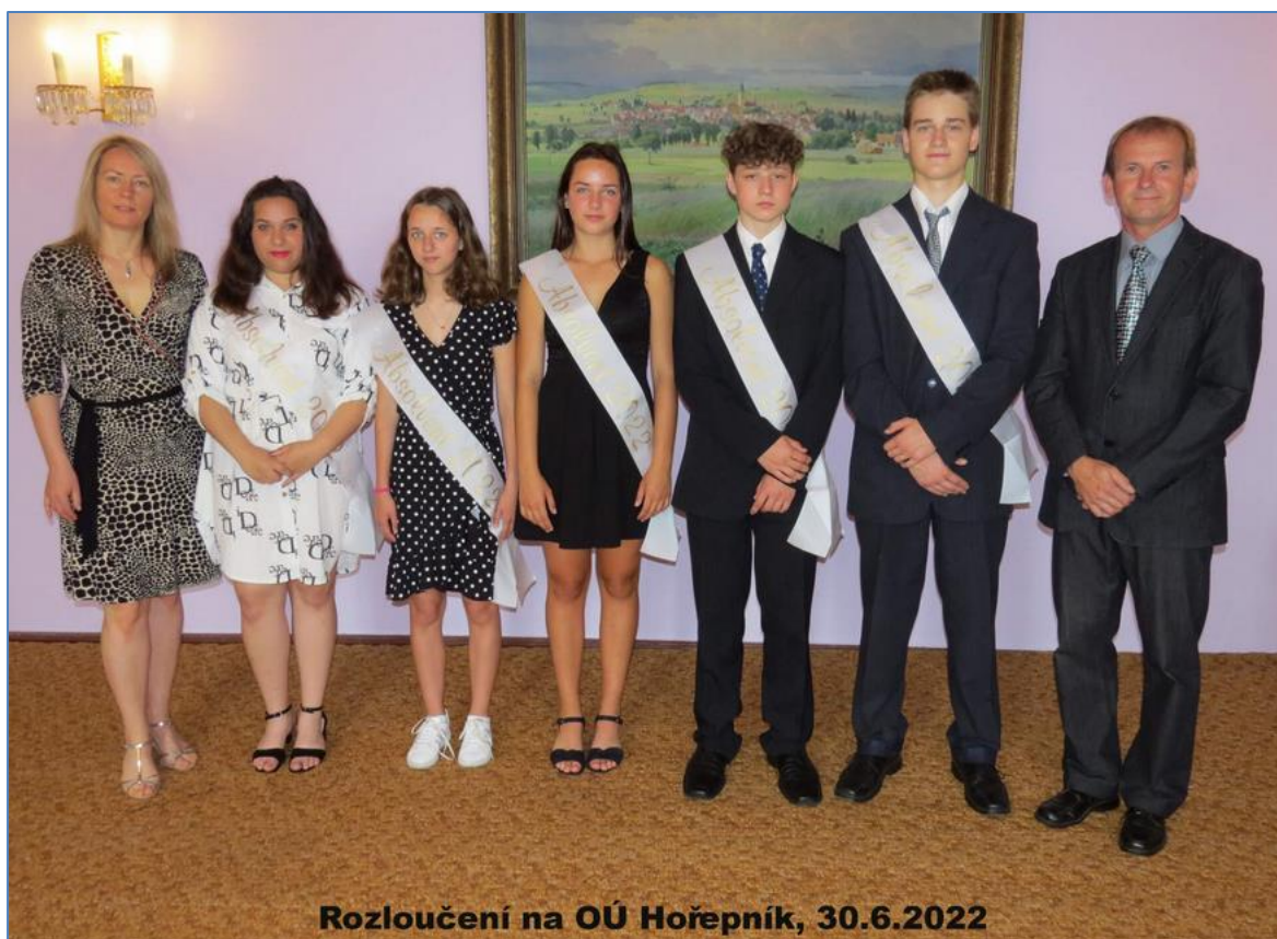
Rozloučení na OÚ Hořepník, 30.6.2022